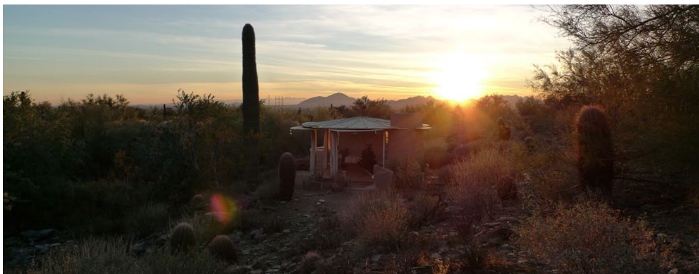
Desert shelter The Lotus , Arizona

Men hvad der er kernen i min rejse og hvad som var svært aflæseligt i mørket den aften i Oktober, hvor jeg stod ved porten indtil Taliesin West's sekshundrede hektar store ørkenareal, var hvordan denne rejse har sprængt rammerne for hvad min forståelse for arkitek-