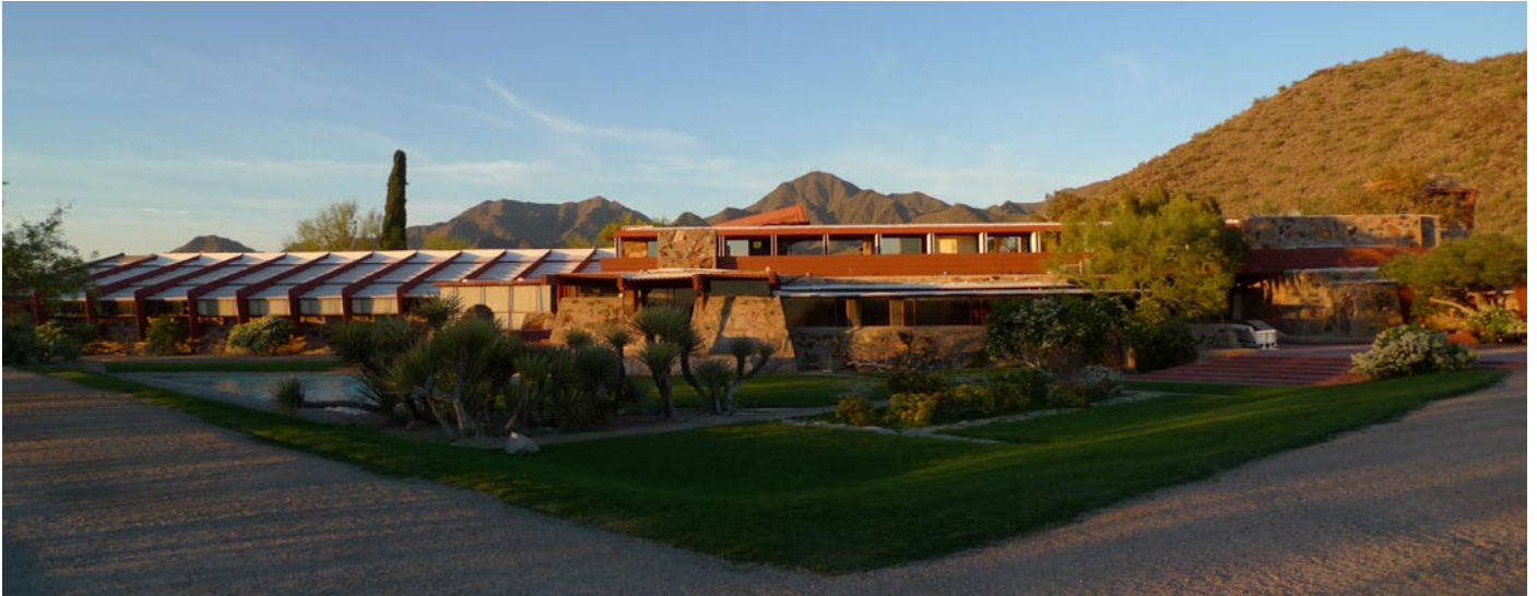
Taliesin West, Arizona

Taliesin West, Arizona samt Taliesin, Wisconsin