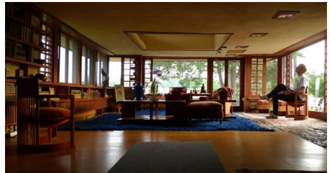
FLLW Bedroom, Taliesin Wisconsin