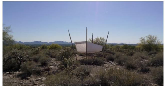
My shelter, Taliesin West Arizona