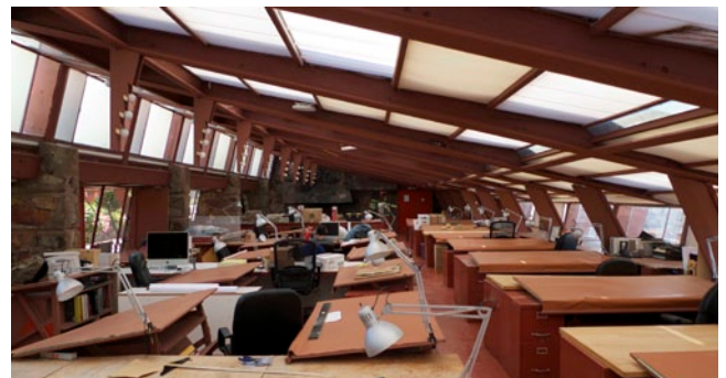
Drafting Studio Taliesin West Arizona