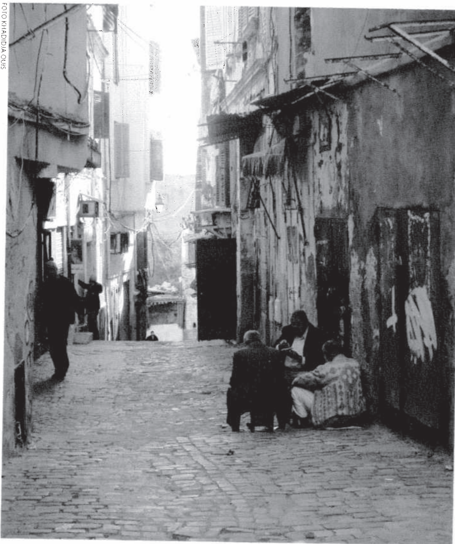
Trots att många hantverksbutiker idag har försvunnit, är gatan fortfarande en mycket viktig social mötesplats särskilt för männen, som ofta ses spela spel tillsammans eller samtala över en kopp kaffe eller te.