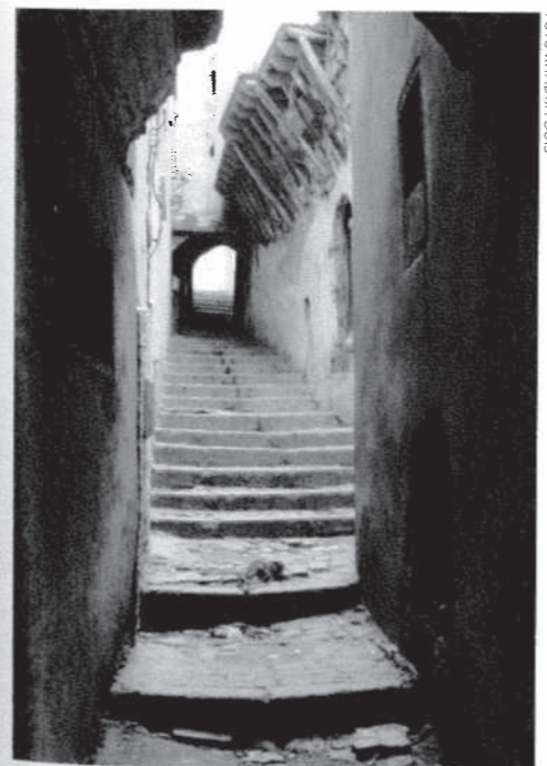
De smala gatorna ger ett behagligt svalt klimat. Otoliga trappsteg skapar en karakteristisk stadsbild.

»Det saknas inte pengar, men det saknas en reell politisk vilja!« påpekar en ung arkitekt som engagerat sig för bevarandet av kasbah. Det finns ett stort engagemang i frågan och debatten rasar dagligen i media.