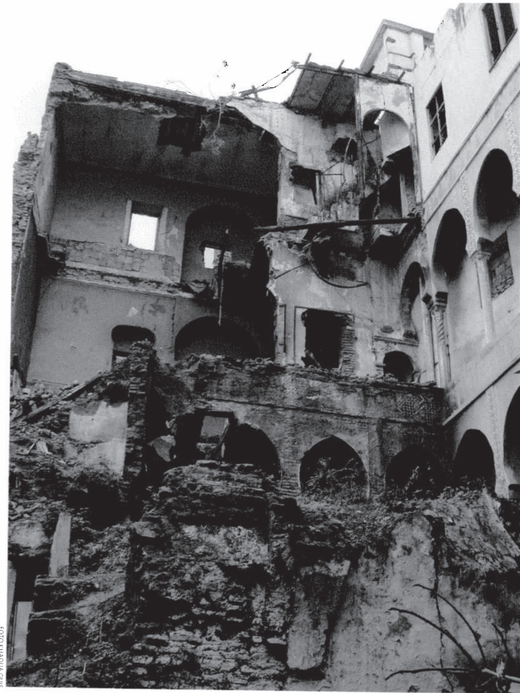
Många byggnader i kasbah är i ruiner eller bedöms vara i kritiskt tillstånd. Ruinerna bär spår av de innergårdar med marmorarkader som en gång funnits här, ofta dekorerade med kakel och kalkmålade väggar.

Trots att många familjer flyttade ifrån kasbah finns det flera som stannat kvar. Jag lär snart känna en ung kille vars familj har ägt sitt