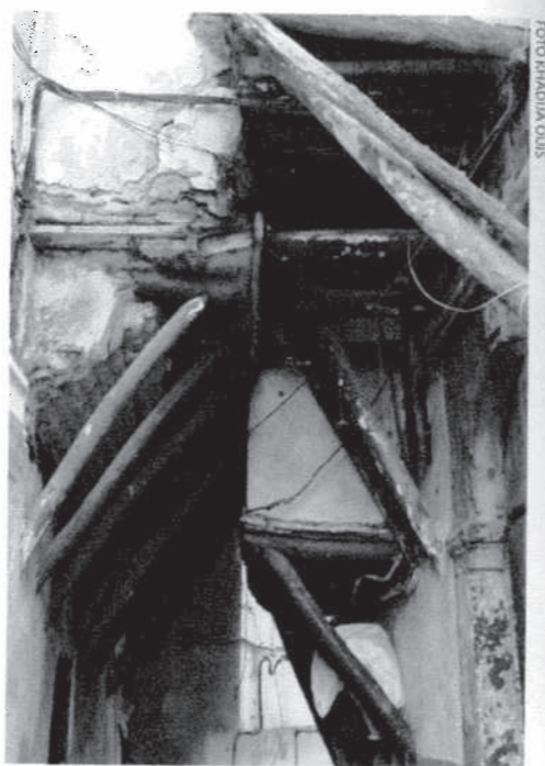
Husen av lera och tegel är byggda för att stötta varandra – ibland även över gatorna. Väggarna är målade med kalkfärg.

För många boende är enda möjligheten att komma bort härifrån om deras hus är så allvarligt förfallet att myndigheterna till slut erbjuder familjen ett annat boende. Tyvärr får den politiken förödande konsekvenser. I ren desperation börjar människor slå sönder sina månghundraåriga hus, för att visa att de inte längre kan bo kvar. »INGEN VILL BO HÄR« , suckar en medelålders kvinna uppgivet. Hon är ensamstående med sina två döttrar och bor i litet fuktigt rum utan fönster. En av hennes grannfamiljer på tio personer bor i ett rum om knappt 15 kvadratmeter. Den extrema trångboddheten tär hårt på såväl hus som på människor. För andra är de fallfärdiga husen närmast en livsfara att bo i. »Är du journalist?« frågar en man när han får se min kamera. »Kom ska jag visa dig hur vi bor«. Han visar mig sitt hem som