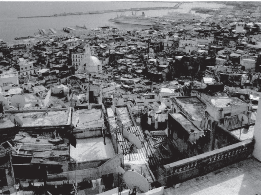
Algers kasbah ligger på en sluttning i den västra delen av stadens bukt. Ner mot hamnen breder den ut sig med sina takterasser och sitt labyrintiska gatunät. Terrasserna användes traditionellt sett av kvinnorna och det var förbjudet att bygga sitt hus så att det skydde grannarnas utsikt mot havet.

hus i sex generationer. Han lovar att visa mig den »riktiga« kasbah – bortom palatsen – en mytomspunnen stad som jag fram till dess bara sett på pittoreska målningar och gamla franska vykort.